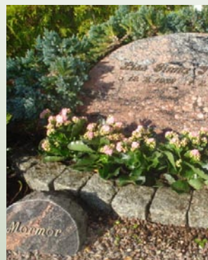
Gravsted på Vodskov kirkegård